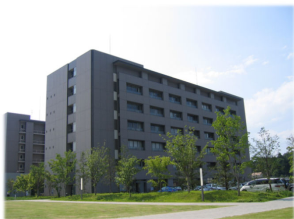
埼玉医大日高キャンパス ゲノム棟 5階 (埼玉県日高市)